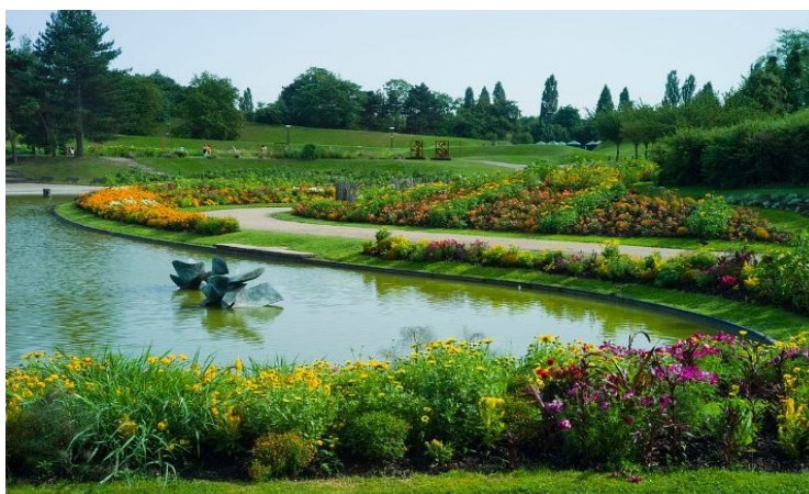
Parc Floral de Paris